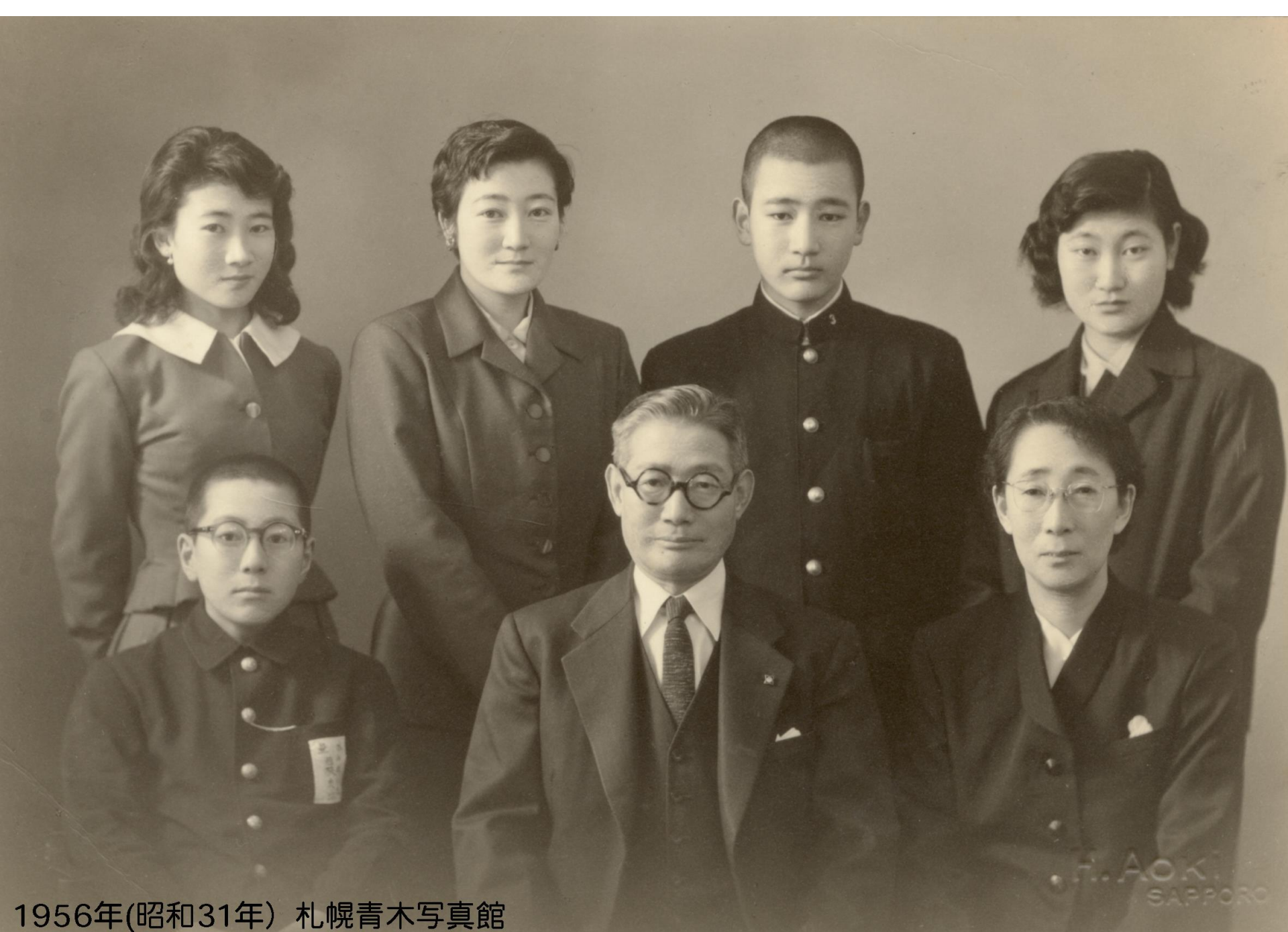
1956年(昭和31年) 札幌青木写真館