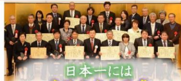
日本一には 農林水産大臣賞 が授与されます