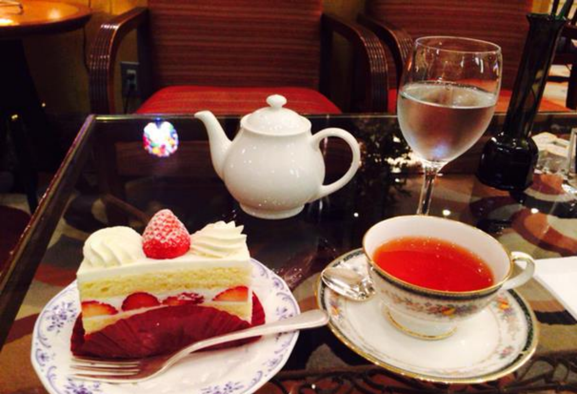
さいたま市民のリモートカフェ