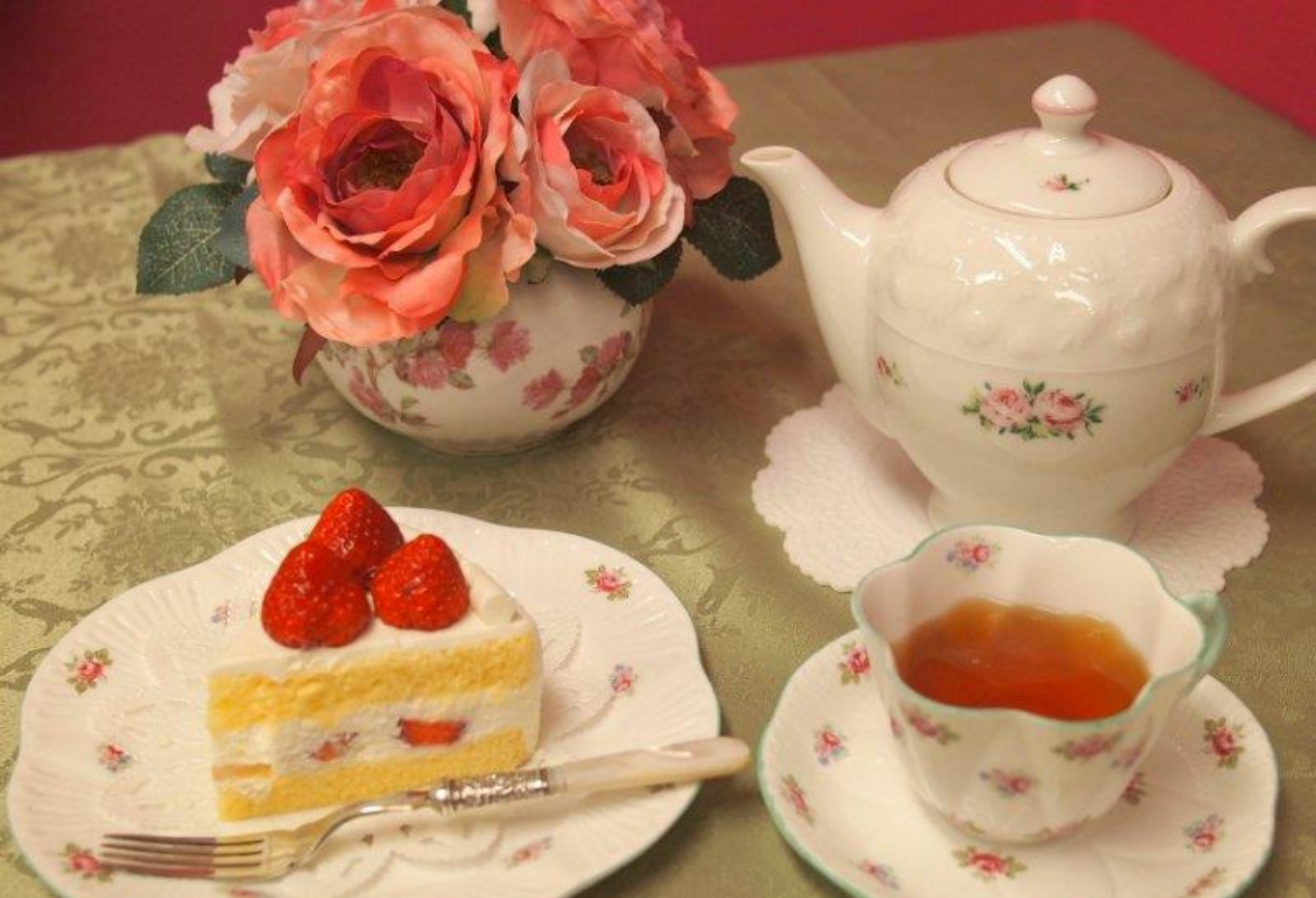
さいたま市民のリモートカフェ